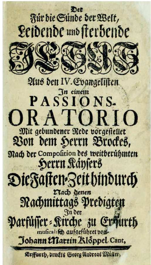
Reinhard Keiser: Titelblatt zur Brockes-Passion, aus dem die mehrtägige Aufführung »nach denen Nachmittags-Predigten« hervorgeht.

Einheitsstiftende Momente in Bachs Musik verbinden die sechs Teile eng miteinander. Mit einer musikalischen Konkordanz zwischen dem allerersten und dem letzten Choral setzt Bach einen Rahmen, der das gesamte Werk vom ersten bis zum sechsten Teil umspannt. Für »Wie soll ich dich empfangen?« und »Nun seid ihr wohl