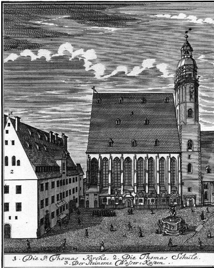
Thomaskirche Leipzig und Schulgebäude. Frontispiz der Thomasschulordnung 1723

trennt aufzuführenden Teilen, die Bach gekannt haben kann. In seiner Heimat Thüringen war es seit dem 17. Jahrhundert üblich, Passionsaufführungen auf mehrere Tage zu verteilen, eine Tradition, die noch bis ins frühe 18. Jahrhundert reicht.