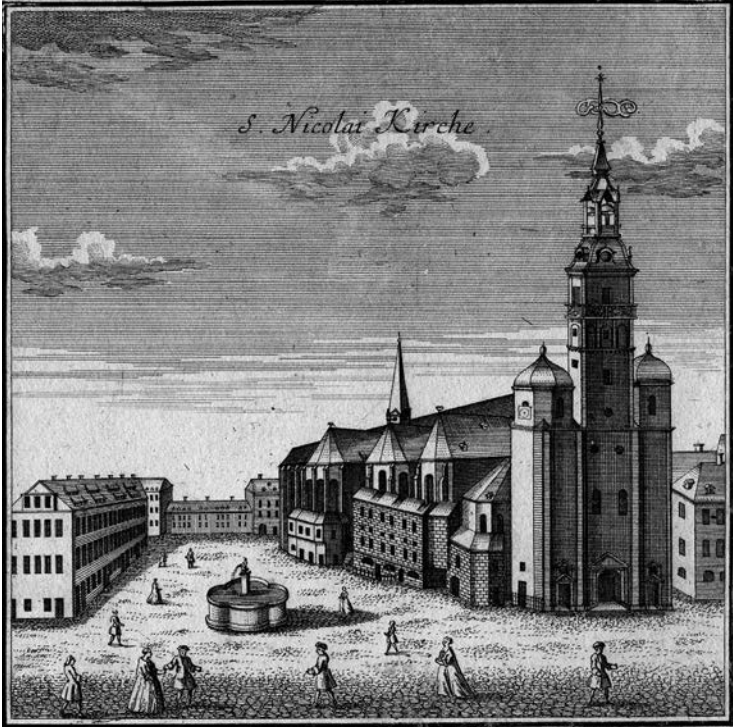
Nikolaikirche Leipzig. Kupferstich

für ein sechsteiliges Weihnachtsoratorium, das an sechs aufeinanderfolgenden Fest- und Sonntagen aufzuführen ist, von dieser Tradition der Passionsaufführung in Mitteldeutschland herrührt. 4 Am Karfreitag 1734, im selben Jahr, in dem das Weihnachtsoratorium entsteht, führt Bach in Leipzig die Passionsmusik Ein Lämmlein geht und trägt die Schuld von Gottfried Heinrich Stölzel auf. Wie es scheint, hat er das Werk an einem Tag aufgeführt (von dieser Aufführung hat sich nur das Libretto erhalten), doch existiert Aufführungsmaterial aus Sondershausen und Gotha, auf dessen Partitur eine Aufführung über zwei Tage – Gründonnerstag und Karfreitag – vermerkt ist. Hinzu kommt noch, dass Stölzels Werk keine dramatische, sondern eine betrachtende – nach innen gewendete – Passion ist. Dieser Wesenszug trifft auch auf das Weihnachtsoratorium zu, das sich eindeutig die Stölzel'sche Passion zum Mus-